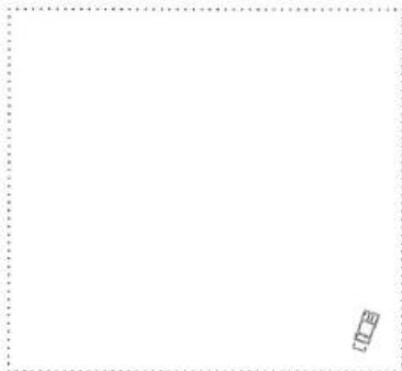
Zaunkönig in einer Zweigkugel