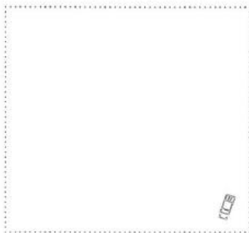
Kohlmeise im Nistkasten