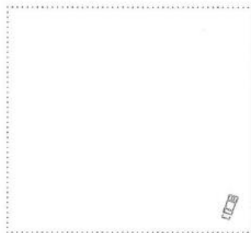
Buntspecht in Baumhöhlen